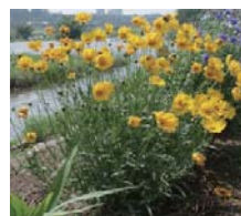
開花期：5月～7月 特 徴：高さ30～70cmで多数の茎がのびる。花は直径5～7cmで鮮やかな黄色。